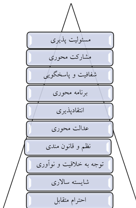
شکل ۱: ارزش‌های کلیدی حاکم بر دانشکده

از دیگر یافته‌های پژوهش حاضر که کمتر در مطالعات راهبردی به آن پرداخته می‌شود تعیین محورهای رشد و توسعه است. در این مطالعه ۴ محور با رویکرد دانشگاه‌های نسل چهارم تعیین شد که در ادامه کلیه تحلیل‌ها بر پایه این ۴ محور قرار گرفته است (شکل ۴).