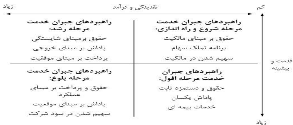
ماتریس ۱، نتیجه کلی پژوهش

با توجه به دیدگاه های ارائه شده در مرحله اول و مقایسه آن با نتایج مرحله دوم، در صورتی که اختلاف بین میانگین فازی زدایی شده در دو مرحله کمتر از (۰/۱) باشد در این صورت فرآیند نظر سنجی متوقف می شود. با توجه به اینکه اختلاف میانگین فازی زدایی شده نظر پاسخ دهندگان در دو مرحله کمتر از ۰/۱ می باشد، پاسخ دهندگان در مورد برنامه های جبران خدمت بر اساس چرخه حیات باشگاه های ورزشی به اجماع رسیدند و نظر سنجی در این مرحله متوقف می شود. این بدان معنی است که پاسخ دهندگان به برنامه های جبران خدمت بر اساس چرخه حیات باشگاه های ورزشی در پژوهش نگاه تقریباً یکسانی داشته اند. به طور کلی نتایج پژوهش را می توان در قالب ماتریس زیر نشان داد.