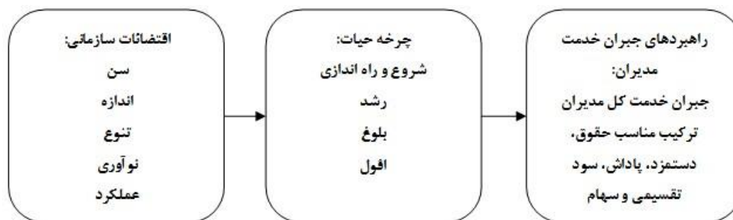
شکل شماره (۲)، چارچوب اقتضایی جبران خدمت مدیران (۵).

در حقیقت فرض اساسی پژوهش حاضر آن است که بنابر پویایی و دگرگونی ذاتی چرخه حیات سازمان، هیئت مدیره و مدیریت عالی برای جبران خدمت مدیران خود باید چگونه تصمیم گیری نماید تا مدیران همواره راضی و پر انگیزه باشند و عملکرد مطلوب از خود نشان دهند و از طرف دیگر این سبک جبران خدمت برای وضعیت کنونی سازمان بهترین تصمیم باشد. از این رو چارچوب اقتضایی ارتباط میان جبران خدمت مدیران و چرخه حیات سازمان را می توان در قالب شکل زیر نشان داد.