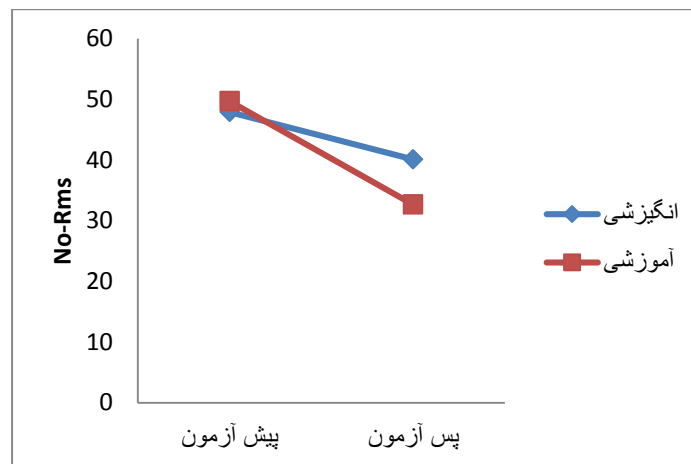
نمودار ۲. مقایسه No-Rms آرنج-میچ در دو گروه خودگفتاری آموزشی و انگیزشی

در بررسی تأثیر خودگفتاری آموزشی و انگیزشی بر دقت پرتاب آزاد بسکتبال، نتایج آزمون تحلیل واریانس با اندازه‌گیری مکرر نشان می‌دهد که اثر اصلی جلسات آزمون با p = /0.01 , F(1, 18) = 14.364 , \eta^2 = /444 معنی‌دار است. بنابراین مشخص است که اختلاف معنی‌داری بین نمرات دقت در پیش‌آزمون و پس‌آزمون وجود دارد و آزمودنی‌ها به طور معنی‌داری در پس‌آزمون بهتر از پیش‌آزمون عمل کرده‌اند. با توجه به معنی‌داری اثر اصلی جلسات آزمون، به منظور تعیین اثر هر یک از انواع خودگفتاری بر دقت پرتاب آزاد از آزمون t وابسته استفاده شد. در گروه خودگفتاری آموزشی نتایج آزمون t وابسته نشان داد که اختلاف بین میانگین‌های امتیاز دقت در دو مرحله به نفع پس‌آزمون معنی‌دار است و نشان می‌دهد که خودگفتاری آموزشی به طور معنی‌داری ( t = 4.388 , df = 9 , p = /0.02 ) بر دقت پرتاب آزاد بسکتبال تأثیرگذار است و موجب بهبود آن می‌شود. همچنین اندازه اثر ( d = 1/43 ) بزرگ و درخور توجه بوده است که نشان می‌دهد تأثیر خودگفتاری آموزشی بر دقت پرتاب آزاد بسکتبال زیاد است. اما در گروه خودگفتاری انگیزشی نتایج آزمون t