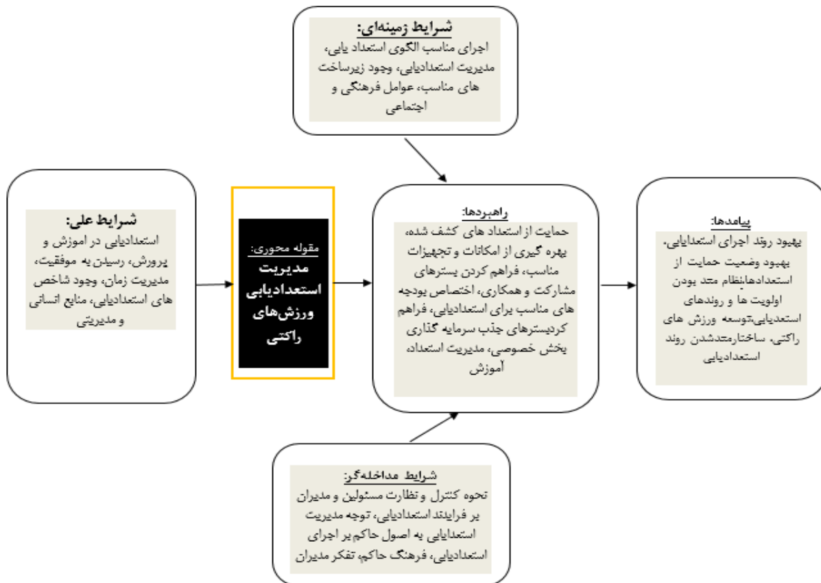
شکل ۱. مدل پارادایمی مدیریت استعدادیابی به روش استراس و کوربین در ورزش‌های راکتی

این مرحله از پژوهش کدگذاری گزینشی و مدل نهایی ارائه می‌گردد. در مرحله کدگذاری گزینشی یا انتخابی شکل‌گیری و پیوند هر دسته‌بندی با سایر گروه‌ها تشریح می‌شود. در این قسمت کدگذاری‌های محوری به صورت ترکیبی و محتوای هر یک از آنها در قالب کدهای نظری قرار داده شدند که در جدول زیر ارائه گردید: