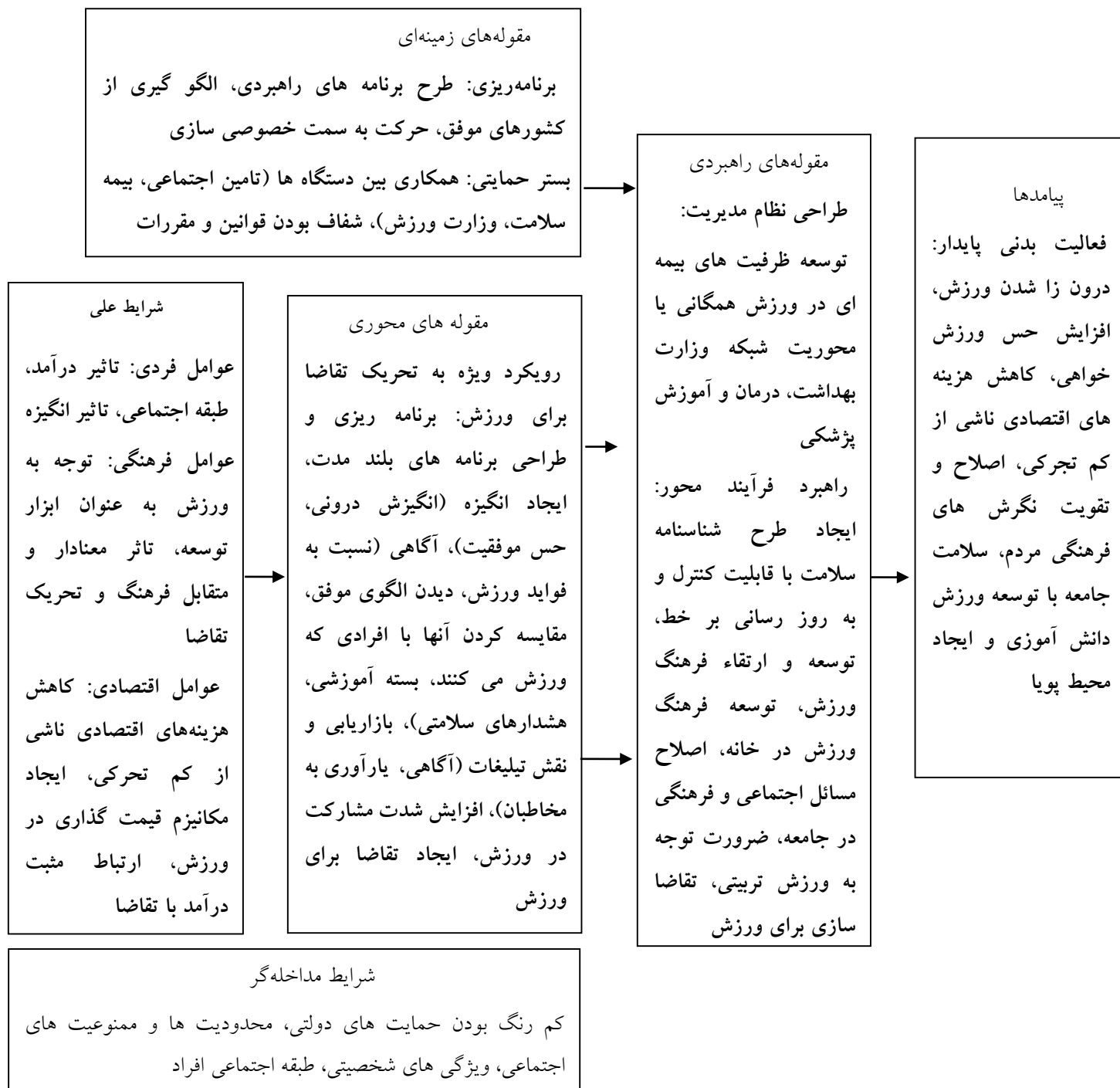
شکل ۱. الگوی تحریک تقاضا برای ورزش در جامعه ایرانی

گزاره‌های حکمی (قضایای) پژوهش گزاره‌های حکمی یا قضایای نظریه همان قضایا یا فرضیه‌هایی هستند که روابط بین مقوله‌ها، را با پدیده محوری بیان می‌کنند (۲۲). بر پایه مؤلفه‌های کدگذاری محوری این تحقیق، قضایای زیر به دست می‌آیند: