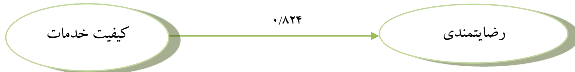
شکل ۱. تأثیر رگرسیونی متغیر کیفیت خدمات بر رضایتمندی

پروورش اندام در حد کم، ۴۶/۶ درصد در حد متوسط و ۴۲/۵ درصد در حد زیاد ارزیابی شده است. همچنین، نتایج نشان داد (شکل ۱ و جدول ۱) در مجموع، متغیر کیفیت خدمات پیش‌بین معناداری برای رضایتمندی مشتریان محسوب می‌شود ( p < 0.01 ), (\beta = 0.824) .